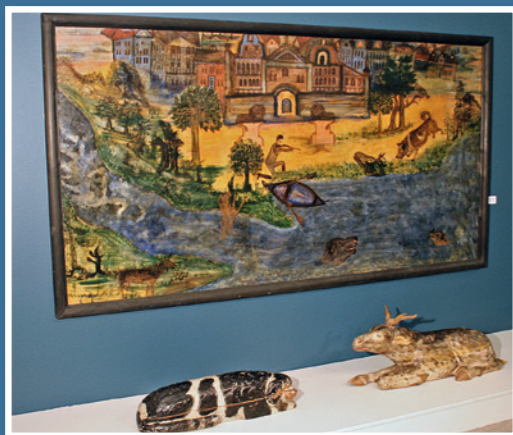
Kungsjakt är vår största målning.