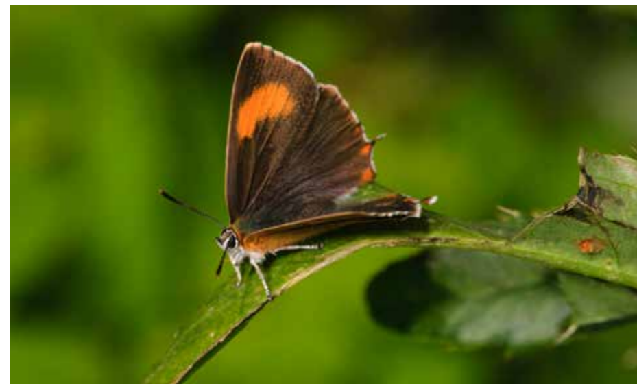
Eldsnavbvinge, Thecla betulae .

Under aktiviteten på biologiska mångfaldens dag dök närmare 70 intresserade åhörare upp för att lyssna till inbjudna gästföreläsare. Publiken var engagerad och