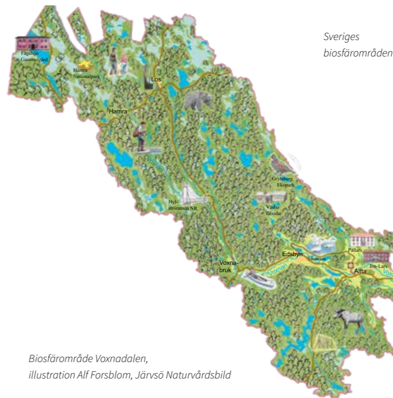
Biosfärområde Voxnadalen, illustration Alf Forsblom, Järvsö Naturvårdsbild