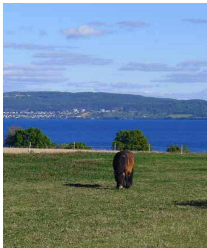
Östra Vätterbranterna

– Skapa delaktighet i bygden, alla ska med. Inte minst då småföretagare och entreprenörer. Var ute mycket bland lokalbefolkningen, se till att synas och få med alla på tåget. Engagera kyrkan. I Jönköping ringde det samtidigt i ett femtontal kyrkklockor i samband med invigningen. Få en samklang med kyrkan och jobba tillsammans med dem. Stötta kyrkan att hitta på olika aktiviteter med biosfärkoppling. Använd biosfärbegreppet som marknadsföring i alla sammanhang. ■