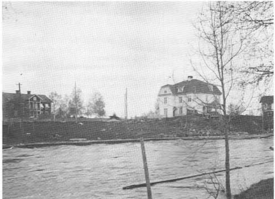
Gårdar i Västanå 1926. Från vänster Kiöhlings, Linders och längst till höger skymtar det nu rivna skomagasinets, den obebyggda tomten Västanå 2:37.

Swartz (Västanå 1:2, 1:4), Linders (Västanå 2:36) och Björkebo (Nordanå 4:51) är tre mycket värdefulla byggnader med panelarkitektur av hög klass. Swartz byggdes 1880 i en högst personlig stil med rikt utsmyckade fasader, där ingen fasad är den andra lik. Linders från 1910-talet och Björkebo byggt 1909 - 10 är uppförda i den assymetriska villastilen. Båda byggnaderna är särskilt värdefulla ur kulturminnesvårdssynpunkt.