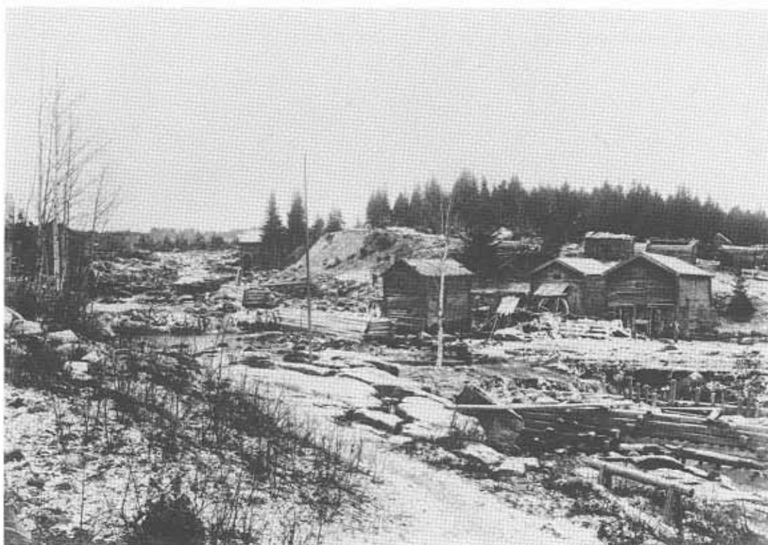
Vattenverk vid Voxnan, Kvarnbackarna, med älvfåran torrlagd.

förr eller senare har bönderna upplevt en sån genomgripande förvandling av sina levnadsbetingelser. Vissa gårdar flyttades ut i skogen utan vägförbindelser en och en halvmil från byn. Visserligen gavs ersättningar till gårdar som flyttades eller till uppförande av nya byggnader, men för många blev det stora ekonomiska problem följt av splittringar och motsättningar inom bygemenskapen.