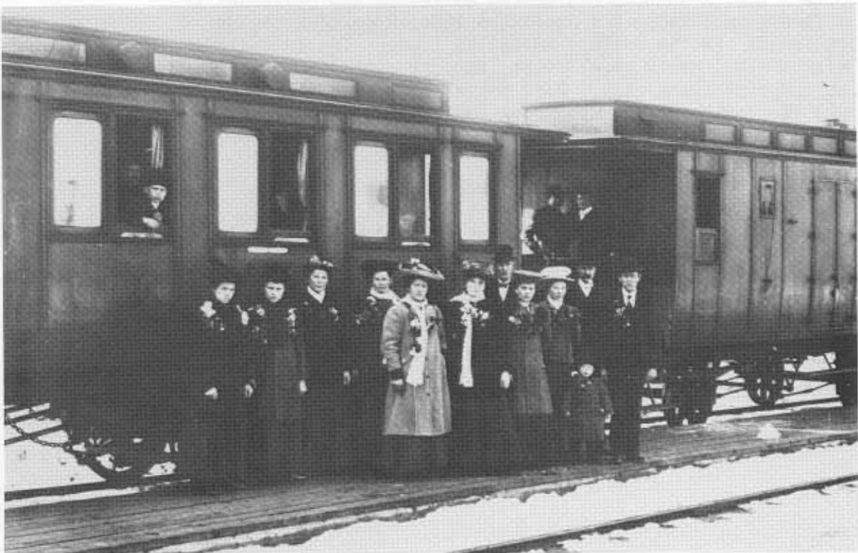
Amerikaresenärer vid Alfta station.