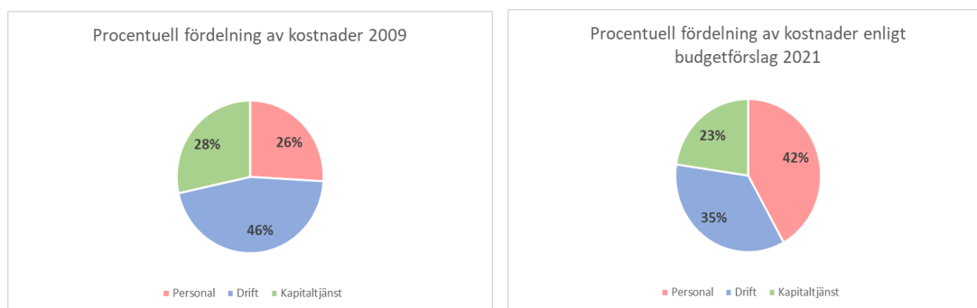
Bild 3 nedan visar de totala kostnaderna för Ovanåkers kommuns VA-verksamhet uppdelat på bruttolönekostnader, drift samt kapitaltjänst under perioden 2009 – 2021 där siffrorna för 2019 avser prognos och 2020 och 2021 avser den budget

Bruttolönekostnaderna har ökat från 5019 tkr till 8991 för prognos 2019. Som jämförelse skulle en årlig höjning på 3%, vilket är högt räknat, landa på cirka 6745 tkr. Vid bolagets bildande utgjorde bruttolönekostnader 26% av totala kostnaderna, medan de i det förslag till budget som Helsinge Vatten upprättat för 2021 utgör 42%. Se bild 1 och 2 nedan.