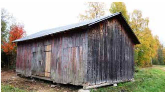
Före och efter.