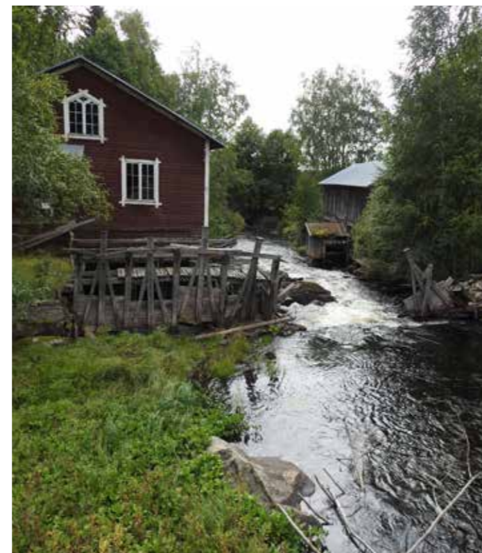
Det trasiga dämnet vid Hässjakvarn. Den potentiella konflikten mellan kulturhistoria och naturvård.