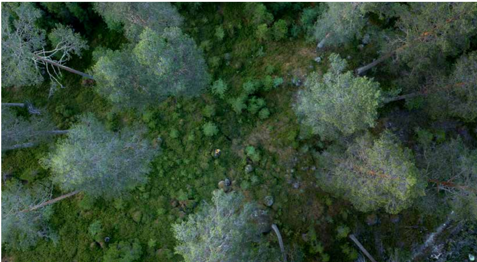
Hur kommer framtidens multifunktionella skogslandskap att se ut?