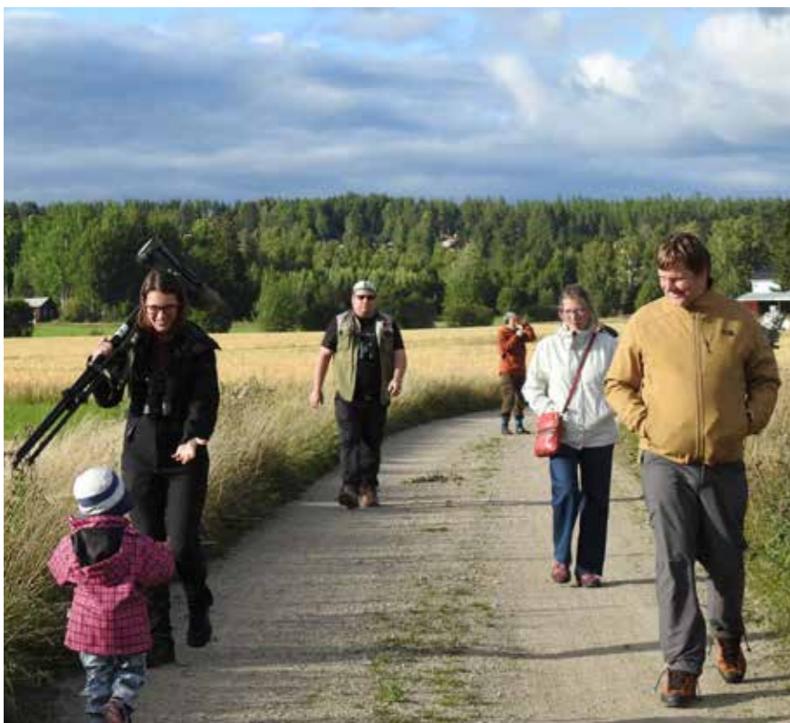
Under besöket gjorde projektgruppen en vandring med fågelskådare vid Sässman. Restaureringen under slutet på 1990-talet och början av 2000-talet har gjort området betydligt attraktivare för fåglar och rekreation.