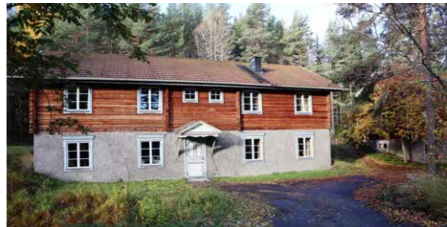
Skålsjögårdens annex.

Nu hoppas både Tv-bolaget och familjen i Skålsjön att det ska bli en riktig vinter med mycket snö. ■