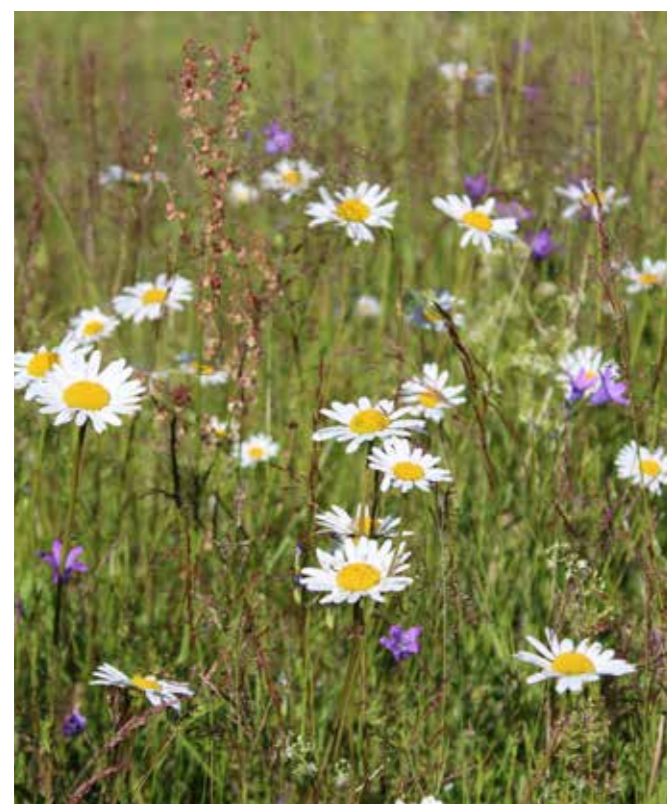
Prästkragar och blålockor i blom.

Både i Ljusdal och Bollnäs finns planer på fler ängsmarker. ■