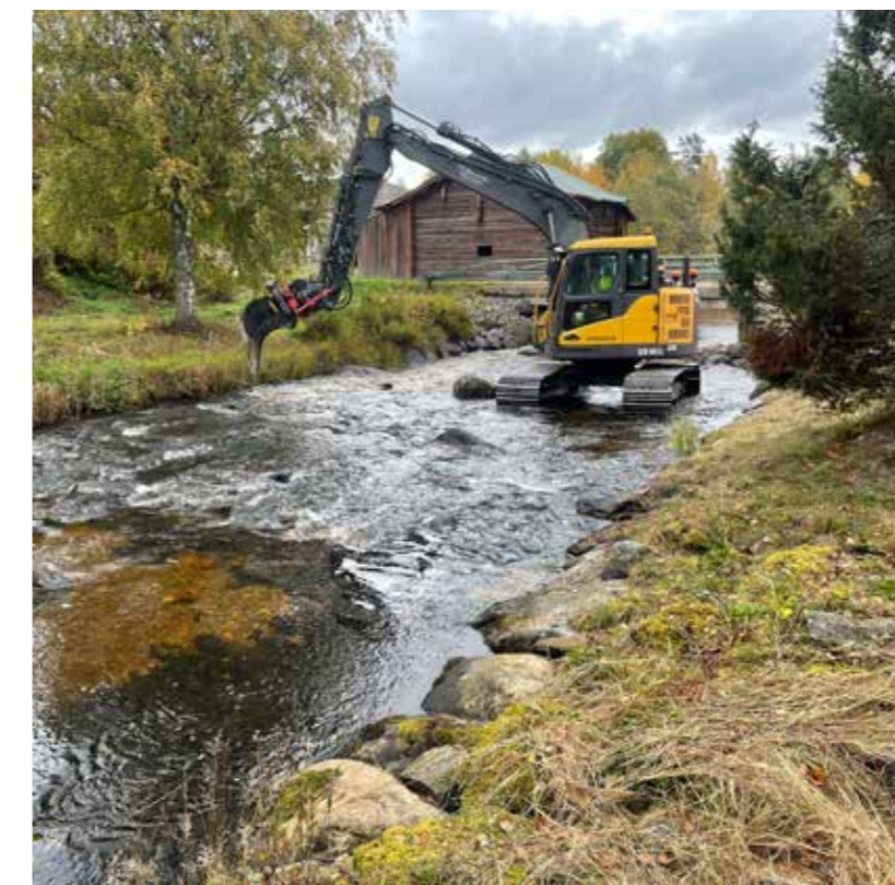
Hässaån har stor potential då det är ett av de större biflödena till älven Voxnan. Mycket arbete kvarstår för att uppnå god ekologisk status, men vi är en bit på väg och tar steg för steg.

Vi vill gärna höra din berättelse om dessa områden - Sässmanområdet, Hässaån, "Svartån" och våtmarken vid Mödånge! Om du vill delta i studien - hör av dig med namn, e-post och telefonnummer så försöker vi få till en intervju. Du kan också gärna skriva en egen berättelse om vad något/några av dessa områden betyder för dig och vilka värden du uppskattar, eller inte uppskattar, och skicka till hakan.tunon@slu.se .