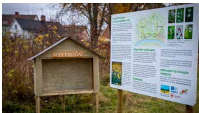
Skylltar informerar om ängsmarker på de utvalda ytorna. Insekshotellet står redo att inredas till våren.