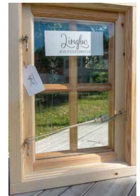
Fönsterbåge av fetved.

Allt oftare ser vi att Voxkedjan inte bara kan skapa jobb och mervärden lokalt utan också "mening" för den skogsägare som har sparat sina tallar i många år – för ett bättre syfte. ■