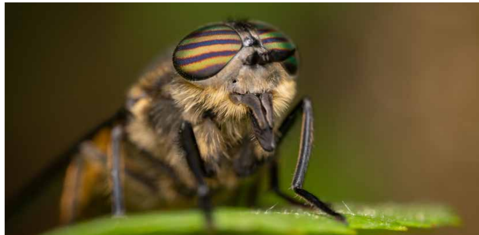
Fluga i närstudie.