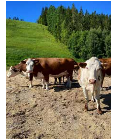
Kor på slalombacken i Edsbyn.

Edsbyns IF Alpina har under tidigare år gått och röjt stora delar av backen för hand, något som har varit ett heldagsjobb och involverat massor av människor.